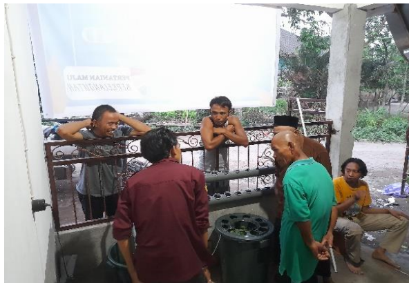
Gambar 4. Pendampingan Pembuatan Budikdamber

Pemeliharaan budikdamber sangatlah mudah dan sederhana. Pemberian pakan ikan dilakukan pada pagi dan sore hari dengan dosis secukupnya. Penambahan dan pergantian air dilakukan seminggu sekali atau air sudah berbau menyengat. Pemanenan sayur kangkung dilakukan dengan menyisakan pangkal kangkung. Untuk awal panen dilakukan 2-3 minggu setelah ditanam. Panen berikutnya dilakukan dalam 1-2 minggu dan seterusnya jumlah panen akan berkurang memasuki bulan ke-3 dan ke-4 pemeliharaan (Affandi et al , 2023). Sedangkan untuk pemanenan ikan lele dilakukan 2-3 bulan setelah penebaran benih. Pada umumnya pemanenan ikan lele dilakukan secara bertahap dikarenakan pertumbuhan lele tidak berlangsung secara merata sehingga lele yang lebih dulu besar yang akan siap dipanen. Adapun hasil dari pembuatan satu model budikdamber ini yaitu ikan lele didapat selama satu bulan pemeliharaan dengan panjang berkisar antara 12-15 cm dan berat \pm 35 g. Pada umumnya ikan lele dapat dipanen selama 2-3 bulan pasca penebaran, sehingga pada kegiatan KKN berlangsung ikan lele belum bisa dipanen. Selain itu kangkung yang didapat 150-200 g per ikat.