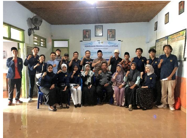
Gambar 3. Kegiatan Sosialisasi Budikdamber

disertai dengan sesi foto bersama seluruh peserta yang hadir pada kegiatan.