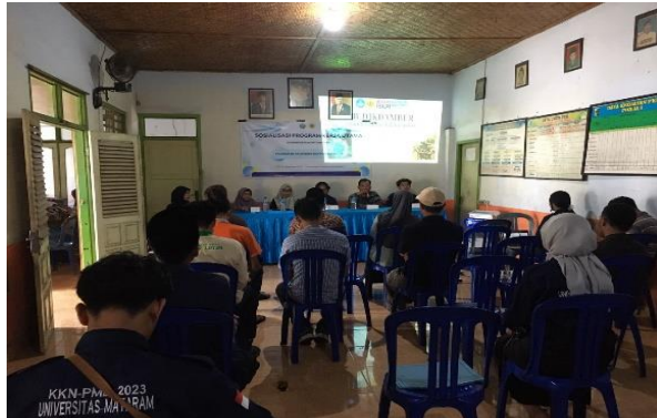
Gambar 2. Penyampaian Materi Budikdamber

mudah diperoleh, budikdamber tidak membutuhkan listrik dan juga ramah lingkungan. Adapun keunggulan dari budikdamber ini menurut Habiburrohan (2018) antara lain: hemat air, zero waste , perawatan yang mudah dan tanpa bahan kimia.